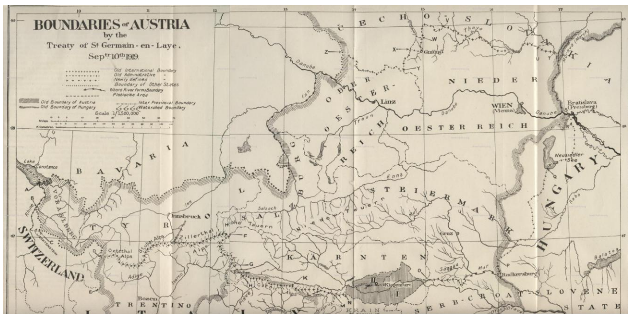
Slika 3: zemljevid, ki je bil priloga senžermenske mirovne pogodbe Vir: http://www.hipkiss.org/cgi-bin/maps.pl?date=1919

Jezerjanom in Jezerjankam je bila tako prihranjena pravica do odločanja o tem, v kateri državi želijo živeti: dvomljiva pravica, saj bi tistih nekaj sto dodatnih glasov, tudi če bi bili vsi za SHS (kar ni samo po sebi umevno: več kot 12000 koroških Slovencev in Slovenk je glasovalo za Avstrijo), ne spremenilo plebiscitnega izida.