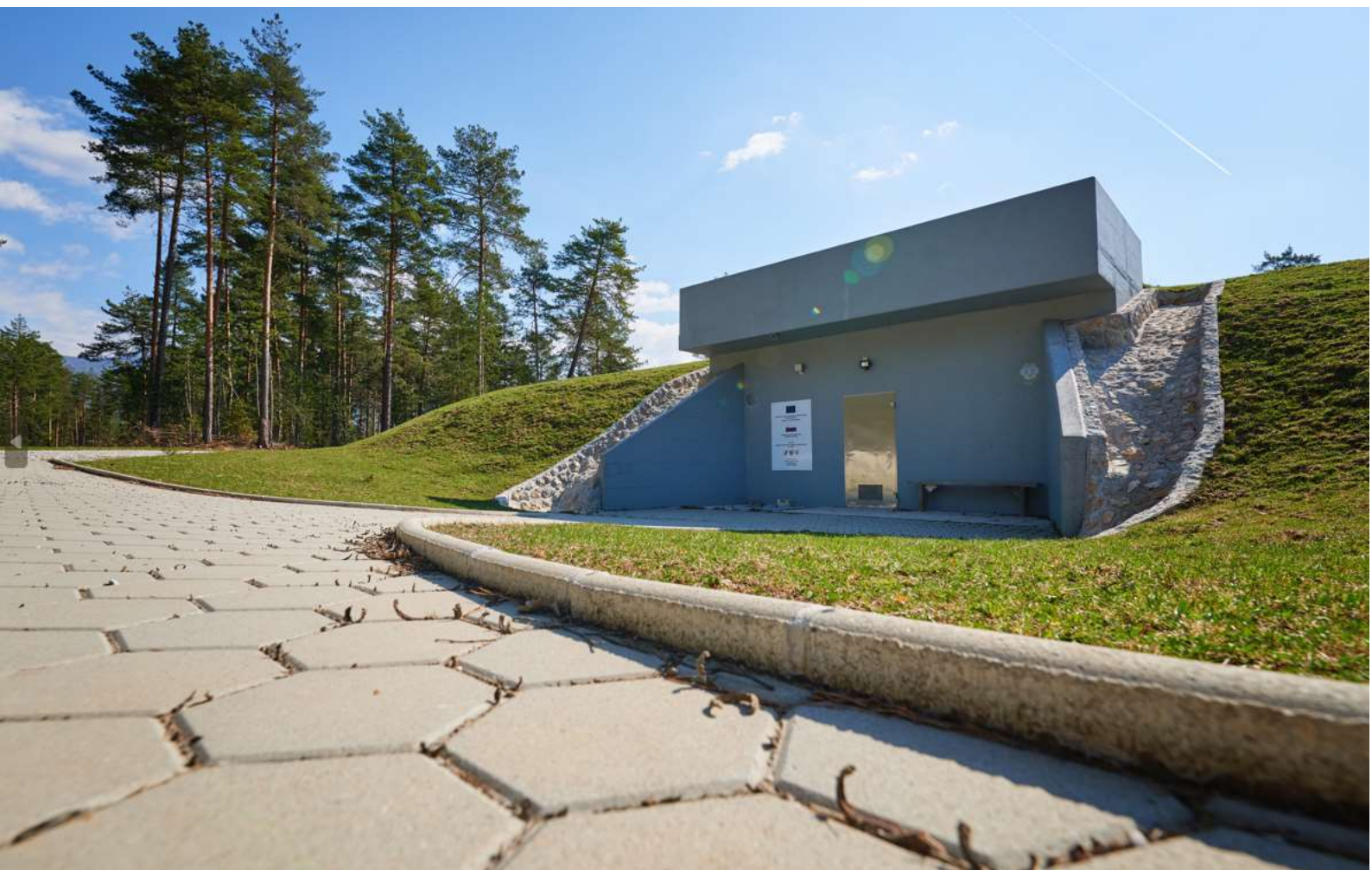
Slika 2: Vodohran Zeleni hrib

Pripravili: Boštjan Dobrovoljc, vodja sektorja Vodovod Polona Kovač, strokovna sodelavka za kontroling